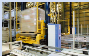
円滑かつ高速の入出庫を実現する